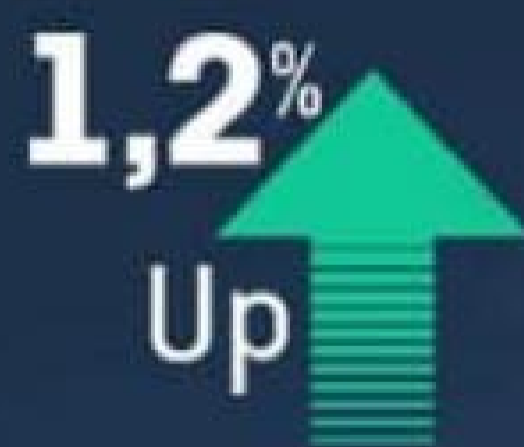
Available Room Nights (ARN)